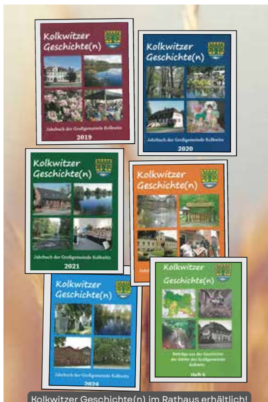
Kolkwitzer Geschichte(n) im Rathaus erhältlich!