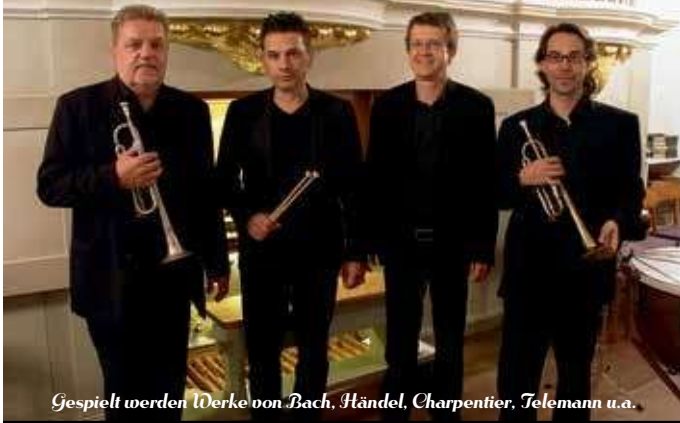
Gespielt werden Werke von Bach, Händel, Charpentier, Telemann u.a.

08.05.2026 um 19.00 Uhr Dorfkirche Kolkwitz (Schulstraße)